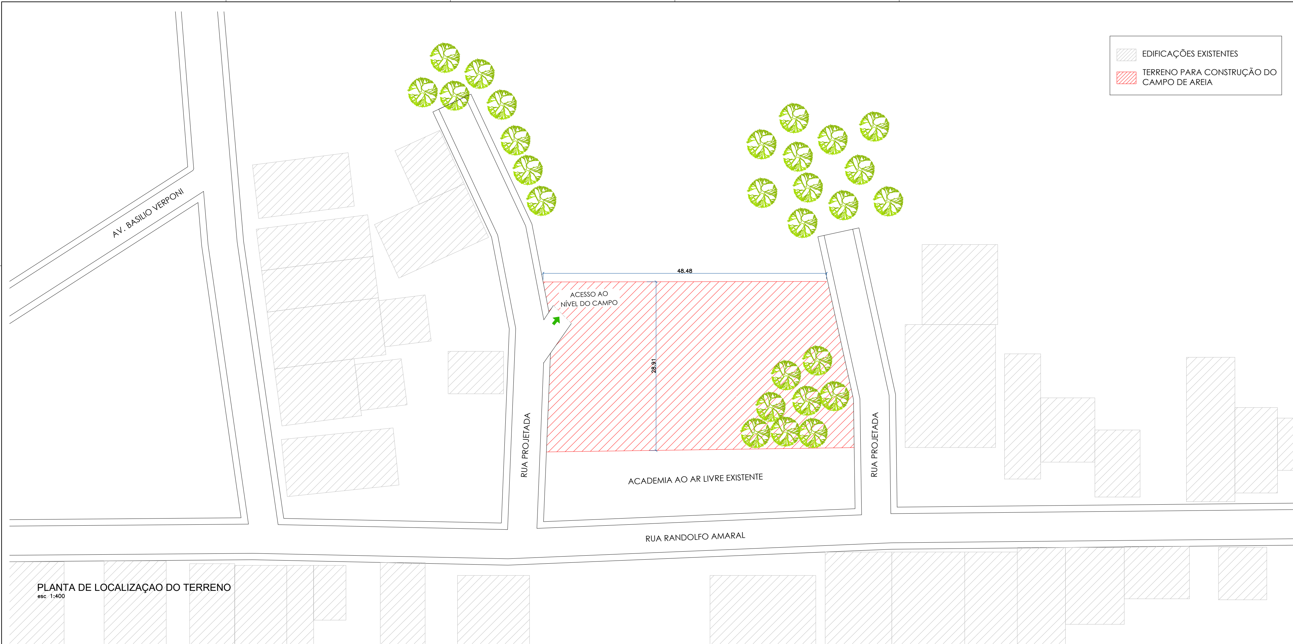
PLANTA DE LOCALIZAÇÃO DO TERRENO esc 1:400